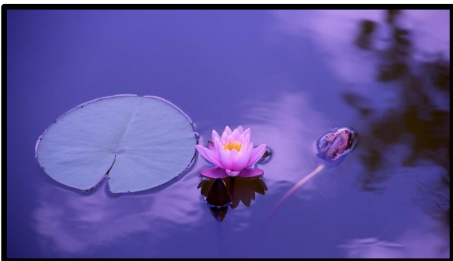
FLOR DE LOTO